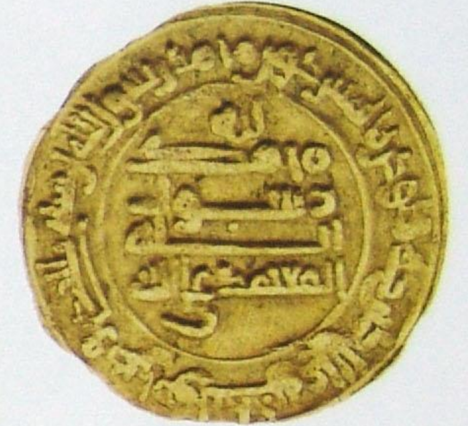
دينار عباسي المعتمد على الله Abbasids Dinar Al Moatamed Ala Allah